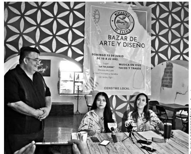
El Bazar se realizará el domingo, de 10 a.m. a 10 p.m.