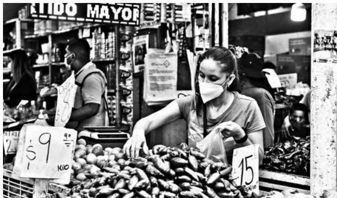
En Torreón se registró una inflación del 6.25 por ciento.