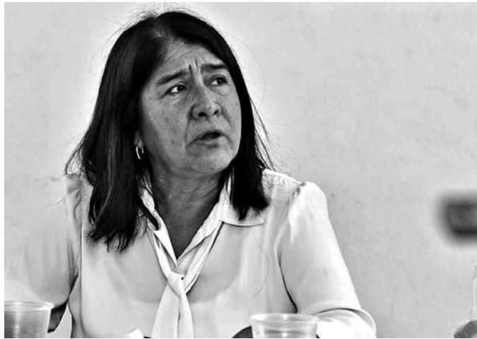
Sánchez dice que ha cuidado su vida política y profesional.