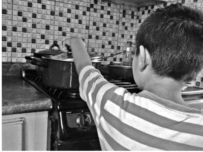
El DIF insta a los padres de familia a no dejar solos a sus hijos.