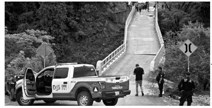
El puente Los Naranjos fu construido en el 2015 con recursos estatales.

Sin embargo, dijo que la inhabilitación del puente significa alrededor de 400 familias que podrían