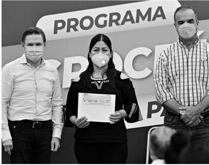
El gobernador dijo que se sigue impulsando programas que ayuden a las familias a reactivar sus negocios.