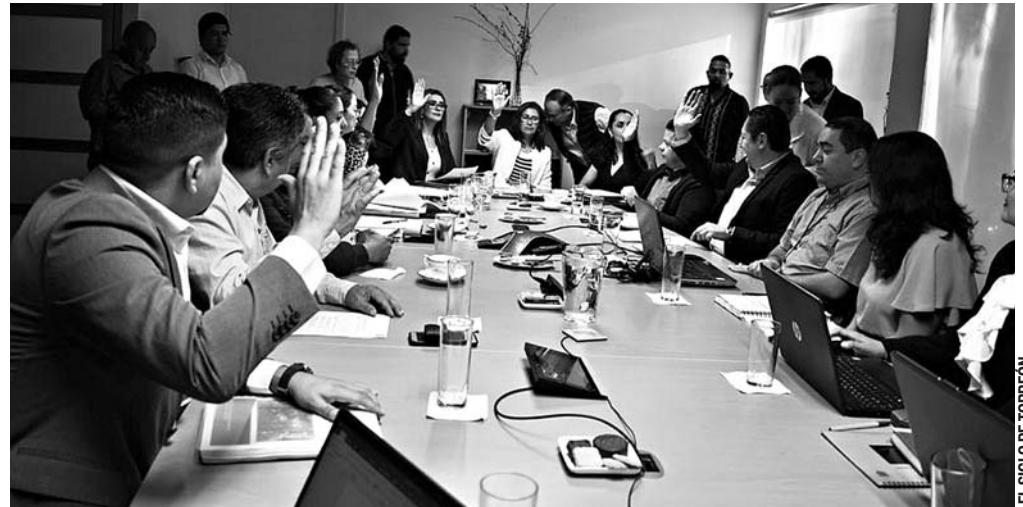
Hay Comisiones que sesionaron más de 30 veces en el primer año del Ayuntamiento.

En ese mismo año de trabajo, la Comisión de