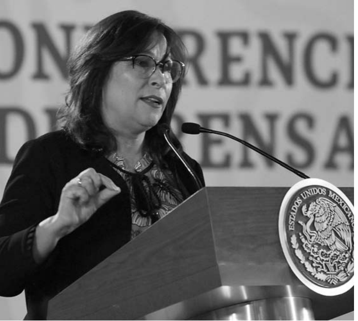
La secretaria de Energía, Rocío Nahle García, señaló que de acuerdo con el promedio de comercialización, se vende más cara en Shell.

Es una distinción que debe considerarse para interpretar con mayor precisión la estructura de precios en los diferentes puntos de venta, expresó.