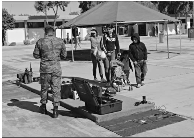
Convocatoria. El acceso al Paseo Dominical de la Sedena es totalmente libre y gratuito, inicia a las 09:00 horas.