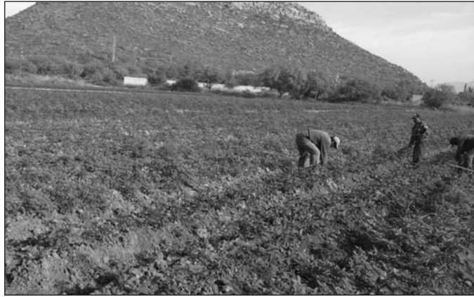
Apoyo. En 2017 se otorgó este apoyo a productores de sandía de Gómez Palacio y Tlahualilo, con el mismo esquema de seguro.