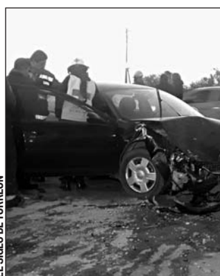
Atención. Diferentes corporaciones de rescate y seguridad acudieron al lugar.

de Control que lo requirió para iniciarle su proceso penal y en los próximos días le determine su situación jurídica en la audiencia de vinculación a proceso.