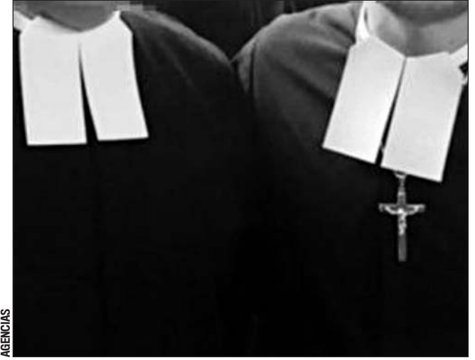
Posturas. Se manifiestan lasallistas y exvoluntarios del Instituto Francés, ante presunto caso de abuso a una joven.

“Estamos totalmente conscientes de que La Salle ha aportado mucho a la construcción de sociedades muy justas, pero también pensamos que reconocer lo que se hace bien, no implica callar lo que se hace mal”, apuntó.