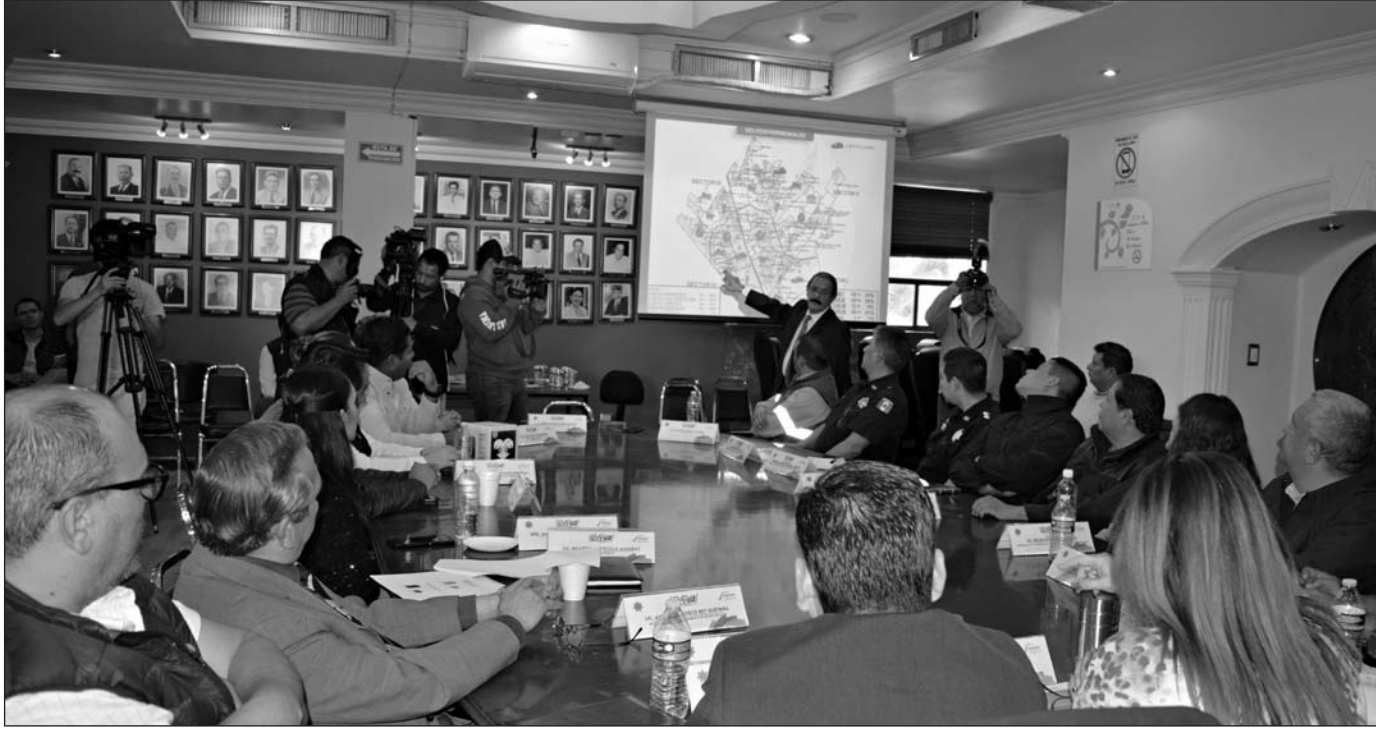
Resultados. Se dieron a conocer durante la reunión de evaluación de indicadores.